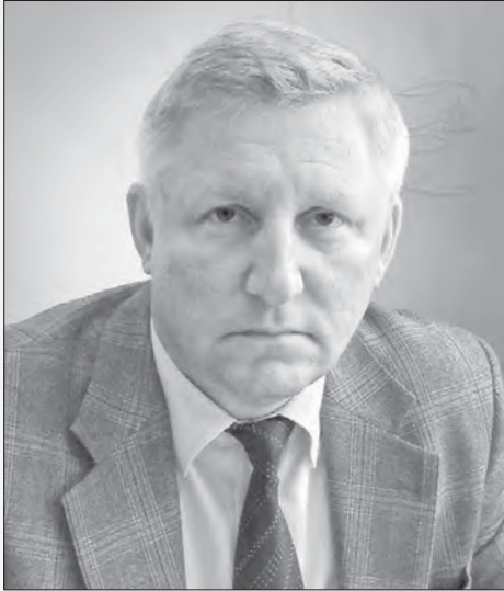
Уважаемые жители и гости Петушинского района!

Во Владимирской области сложилась сложная эпизоотическая обстановка. Практически ежедневно в экстренные службы области приходит информация о случаях возможных заболеваний бешенством среди животных, в том числе, домашних.